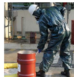
V nujnih primerih: Varnostni kombinezoni in zaščita dihal