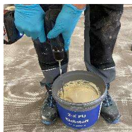
Na splošno in Varnostni čevlji