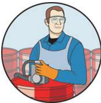
Praznjenje soda s črpalko